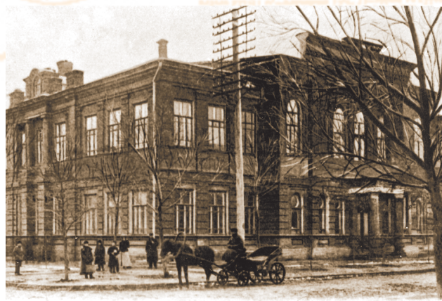
ТТУ с переулочка.