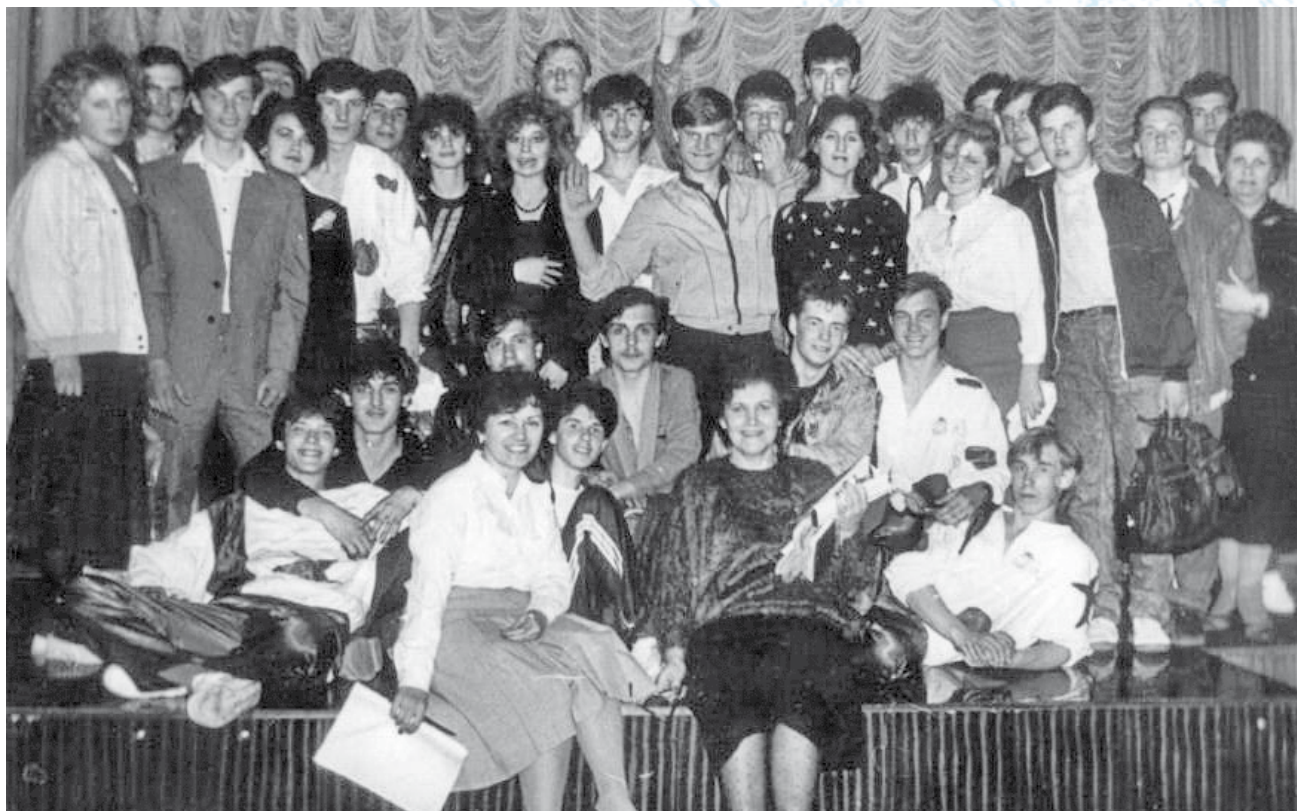
Момент единения наставников и воспитанников