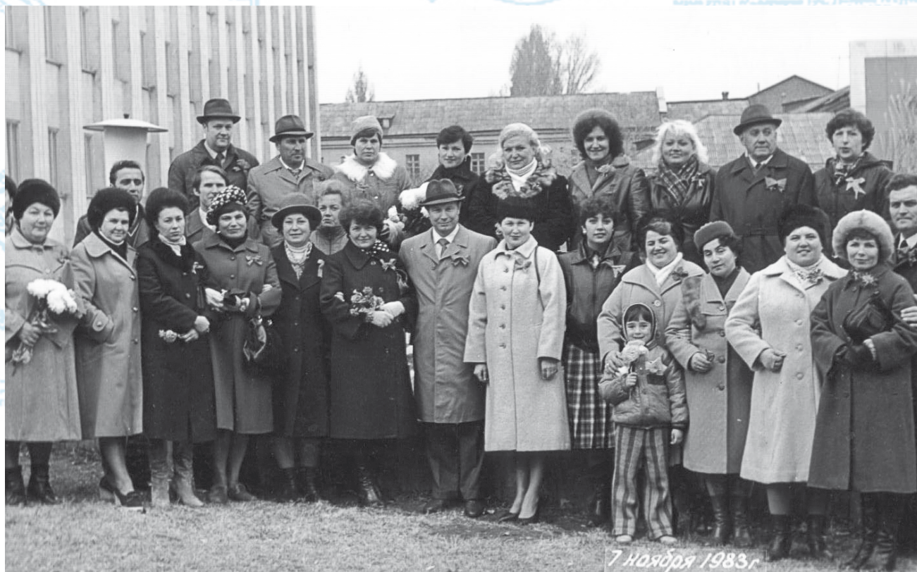
Преподаватели 7 ноября 1983 года