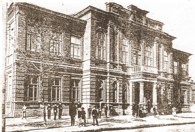
ТТУ с улицы.

три человека. Благодаря этим денежным вливаниям удалось в сжатые сроки осуществить строительство и оборудование нового комплекса сооружений ТТУ.